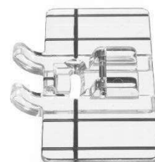
Pied transparent pour borderie