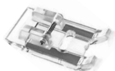
Pied ouvert pour applique