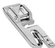
Pied picot ou à ourlet