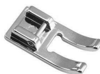
Pied de surjet pour piqûres sur les rebords