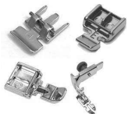
Pied pour fermeture à glissière