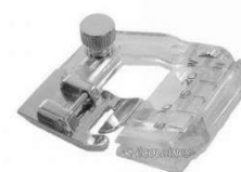
Pied pour le biais